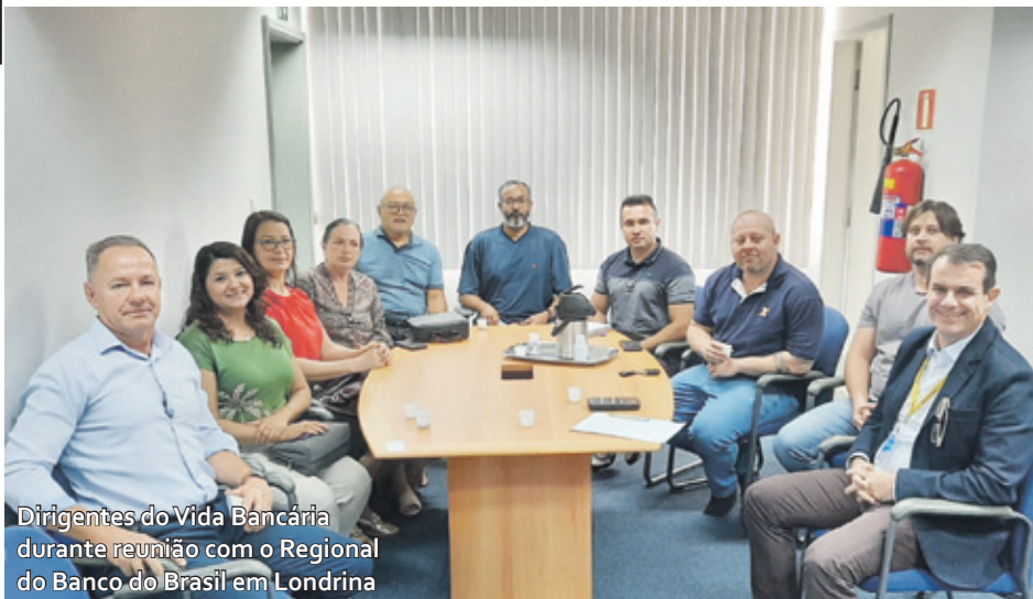
Dirigentes do Vida Bancária durante reunião com o Regional do Banco do Brasil em Londrina