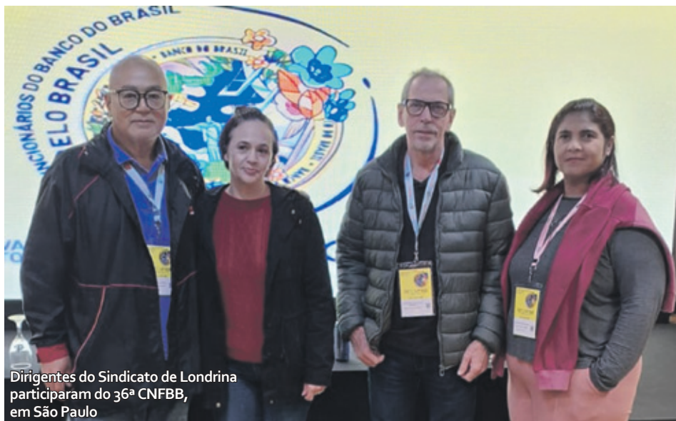
Dirigentes do Sindicato de Londrina participaram do 36º CNFBB, em São Paulo