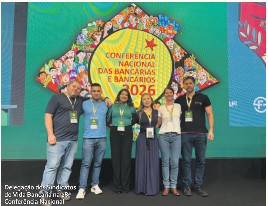
Delegação dos Sindicatos do Vida Bancária na 28ª Conferência Nacional

A categoria defendeu ainda como prioritária a defesa dos empregos no setor, melhorias nos planos de saúde e combate ao assédio moral. Nas perguntas a respeito das inovações tecnológicas, bancários e bancárias não foram contra as mudanças, porém deixaram claro que as mesmas precisam ser acompanhadas de uma remuneração maior para compensar os ganhos de produtividade pelos bancos.