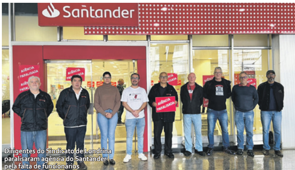
Dirigentes do Sindicato de Londrina paralisaram agência do Santander pela falta de funcionários