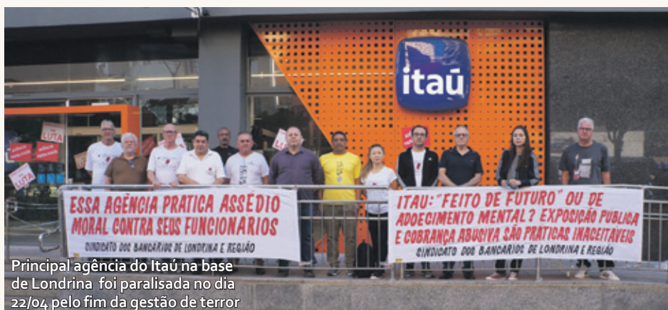
Principal agência do Itaú na base de Londrina foi paralisada no dia 22/04, pelo fim da gestão de terror

Durante meses, segundo relatos encaminhados ao Sindicato, a rotina dos empregados daquela agência passou a ser marcada por intensa pressão por resultados, cobranças excessivas e práticas que teriam contribuído para um ambiente de insegurança e sofrimento psíquico. Os relatos apontam para situações de esgotamento físico e emocional, crises de ansiedade e outros impactos na saúde mental dos trabalhadores. Este episódio deixa uma lição importante para