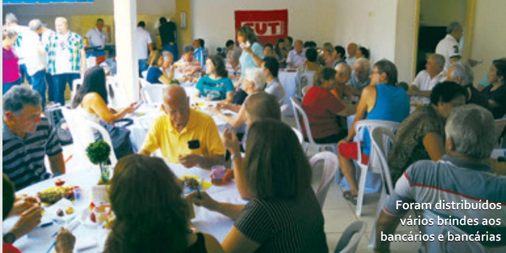
Foram distribuídos vários brindes aos bancários e bancárias