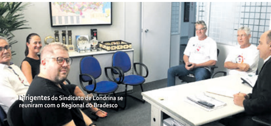
Dirigentes do Sindicato de Londrina se reuniram com o Regional do Bradesco

Lucro de R$ 21,564 bilhões - O Bradesco obteve lucro líquido de R$ 21,564 bilhões em 2018, valor que aponta um crescimento de 13,4% em relação ao resultado apurado no exercício anterior. O banco anunciou que vai antecipar o pagamento da PLR (Participação nos Lucros e Resultados) para o dia 6 de fevereiro.