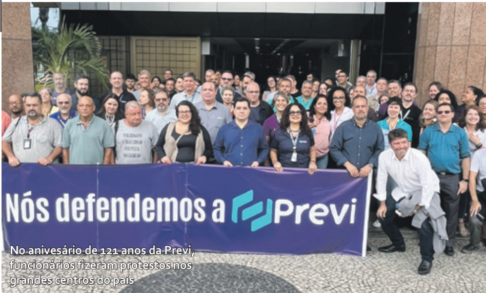
No aniversário de 121 anos da Previ, funcionários fizeram protestos nos grandes centros do país