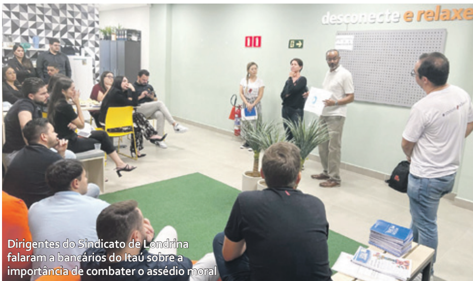
Dirigentes do Sindicato de Londrina falaram a bancários do Itaú sobre a importância de combater o assédio moral